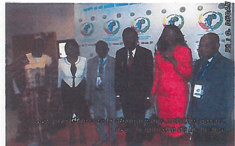
Les membres de la Commission des Affaires africaines de l'Union internationale du Notariat se réunissent avec le ministre de la Justice