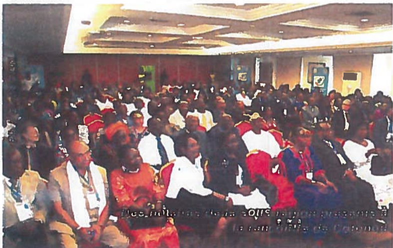
Des milliers de participants à la 11 e édition des Universités des Notaires d'Afrique

Enfin, au nom du président de la République, le Garde des Sceaux, ministre de la Justice et de la Législation, Me Joseph Djogbénou, laisse entendre que le notariat constitue une grande préoccupation en ce que ses enjeux et défis, aujourd'hui, touchant à l'environnement économique, méritent qu'on s'y attarde. Suivant le Garde des Sceaux, l'université doit s'entendre ici comme cadre de mutualisation ; ce dont rassurent les centres d'intérêt conviés aux débats. Puis Joseph Djogbénou relève que les efforts de législation au Bénin ces dernières années, avec l'avènement du code foncier et domanial, n'ont pas vraiment réglé tous les problèmes. Il déplore l'absence consacrée du notaire dans maints domaines et souligne qu'en Afrique l'on croit disposer de tout l'espace et qu'en conséquence, l'on construit en longueur plutôt qu'en hauteur. Or, les temps changent et il faut désormais tenir compte des exigences spatiales. Mais à l'université, le Garde des Sceaux veut allier l'universalité, tant le langage technique est le même ici ou là même si la Common Law doit être domptée par les francophones. Ce disant, il rassure les notaires de la volonté du gouvernement de les voir se développer plutôt que de disparaître comme certains le craignent.