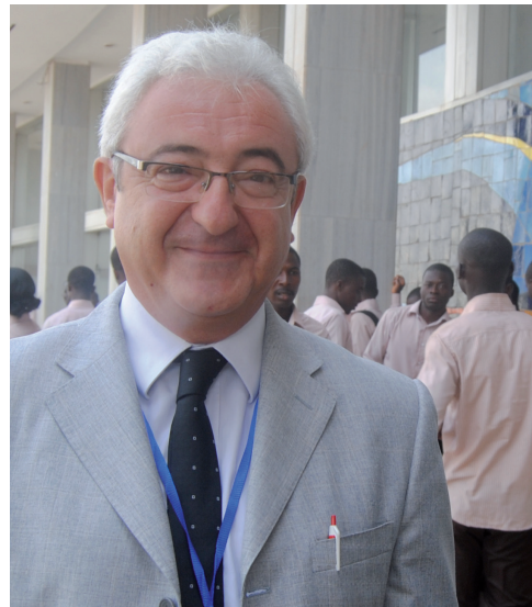
ASSOCIATION PARLEMENTAIRE FRANCOPHONE

Nous avons, avec plusieurs parlements nationaux, lancé un programme expérimental en Côte d'Ivoire pour fédérer