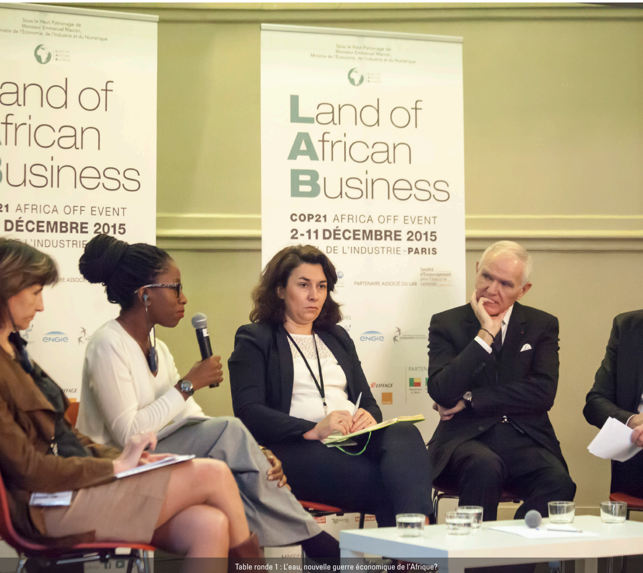
Table ronde 1 : L'eau, nouvelle guerre économique de l'Afrique?

L'ANF a participé au Land of African Business 1 le 11 décembre à Paris.