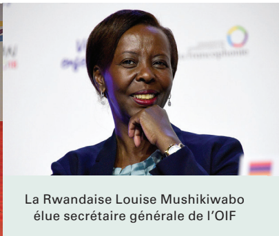
La Rwandaise Louise Mushikiwabo élu secrétaire générale de l'OIF

PLUSIEURS DIZAINES DE CHEFS D'ÉTAT ET DE GOUVERNEMENT membres de la francophonie ont participé au 17 e sommet qui s'est tenu les 11 et 12 octobre 2018 à Érevan en Arménie.